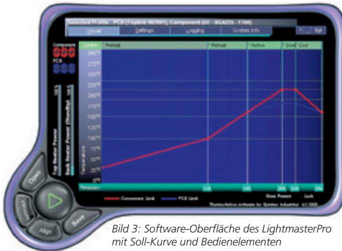
Bild 3: Software-Oberfläche des LightmasterPro mit Soll-Kurve und Bedienelementen

Bild 3 zeigt die Bedienoberfläche der Software, bei deren Entwicklung sehr viel Wert auf einfache Handhabung gelegt wurde. So lassen sich die Temperaturprofile im ‚Visual Screen‘ graphisch als Kurvenverlauf anzeigen; sowohl für die Soll- als auch für die Ist-Kurven. Zum Erstellen der Lötprofile